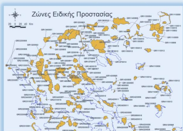
Χάρτης ΖΕΠ Βορείου Ελλάδος ΥΠΕΝ

Είδη Κοινοτικού Ενδιαφέροντος και είδη Προτεραιότητας / Καθορισμός Ζωνών Ειδικής Προστασίας (ΖΕΠ) ως τμήμα του Δικτύου Natura 2000 και μέτρα διαχείρισης.