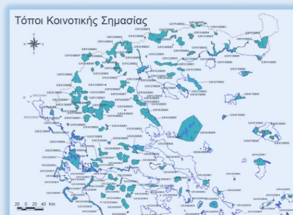
Χάρτης ΤΚΣ Βορείου Ελλάδος ΥΠΕΝ

Ν. 3937/2011 (Τροπ. 1650/1986) «Διατήρησης της Βιοποικιλότητας και Άλλες Διατάξεις» (άρθρο 19 Ν. 1650/1986)