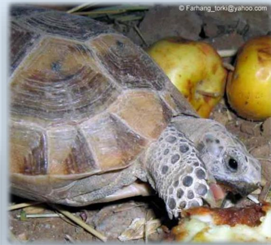
Testudo graeca Reptile Database, 2018