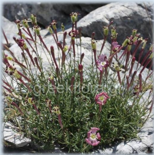
Silene orphanidis Greek Flora, 2017

Π.Δ. 67/1981 «Περί Προστασίας της Αυτοφυούς Χλωρίδος και Άγριας Πανίδος» (και διόρθωση με ΦΕΚ 43/Α/1981): Νόμος Πλαίσιο για την προστασία συγκεκριμένων ειδών χλωρίδας και πανίδας.