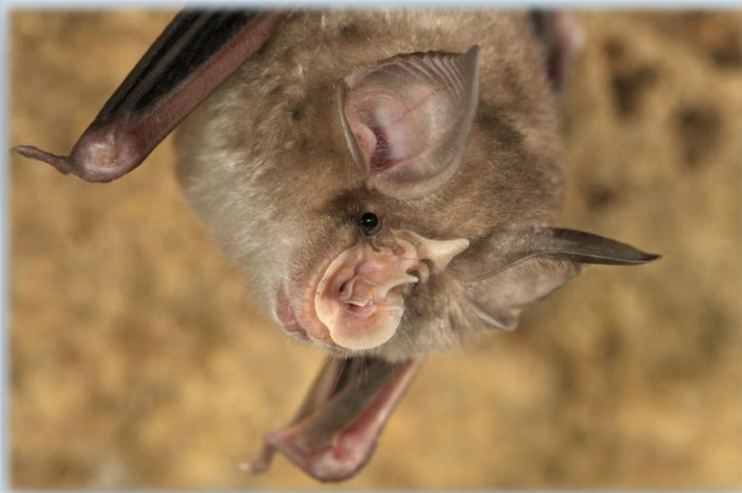
Rhinolophus blasii LIFE Under One Roof, 2018